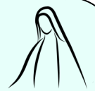
Maria Madre della Chiesa

Confessioni e S. Rosario prima delle Sante Messe