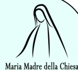
Maria Madre della Chiesa

Confessioni e S. Rosario prima delle Sante Messe