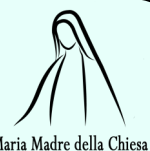
Maria Madre della Chiesa

Confessioni e S. Rosario prima delle Sante Messe