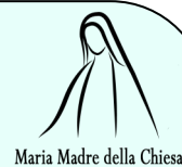
Maria Madre della Chiesa

Confessioni e S. Rosario prima delle Sante Messe