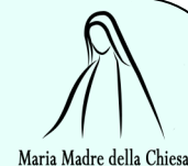
Maria Madre della Chiesa

Martedì 2: ore 09.30 a Santo Janni S. Messa "Commemorazione dei fedeli defunti"