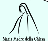
Maria Madre della Chiesa

Confessioni e S. Rosario prima delle Sante Messe