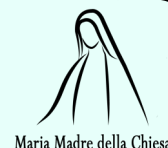
Maria Madre della Chiesa

Sabato 26: ore 16.30 ad Alli S. Messa / ore 18.00 a Santo Janni S. Messa