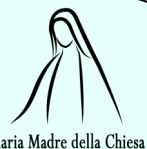
Maria Madre della Chiesa

Confessioni e S. Rosario prima delle Sante Messe