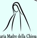
Maria Madre della Chiesa

Lunedì 18: ore 18.30 a Santo Janni S. Messa