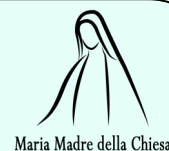
Maria Madre della Chiesa

Confessioni e S. Rosario prima delle Sante Messe