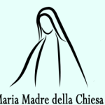
Maria Madre della Chiesa

Confessioni e S. Rosario prima delle Sante Messe